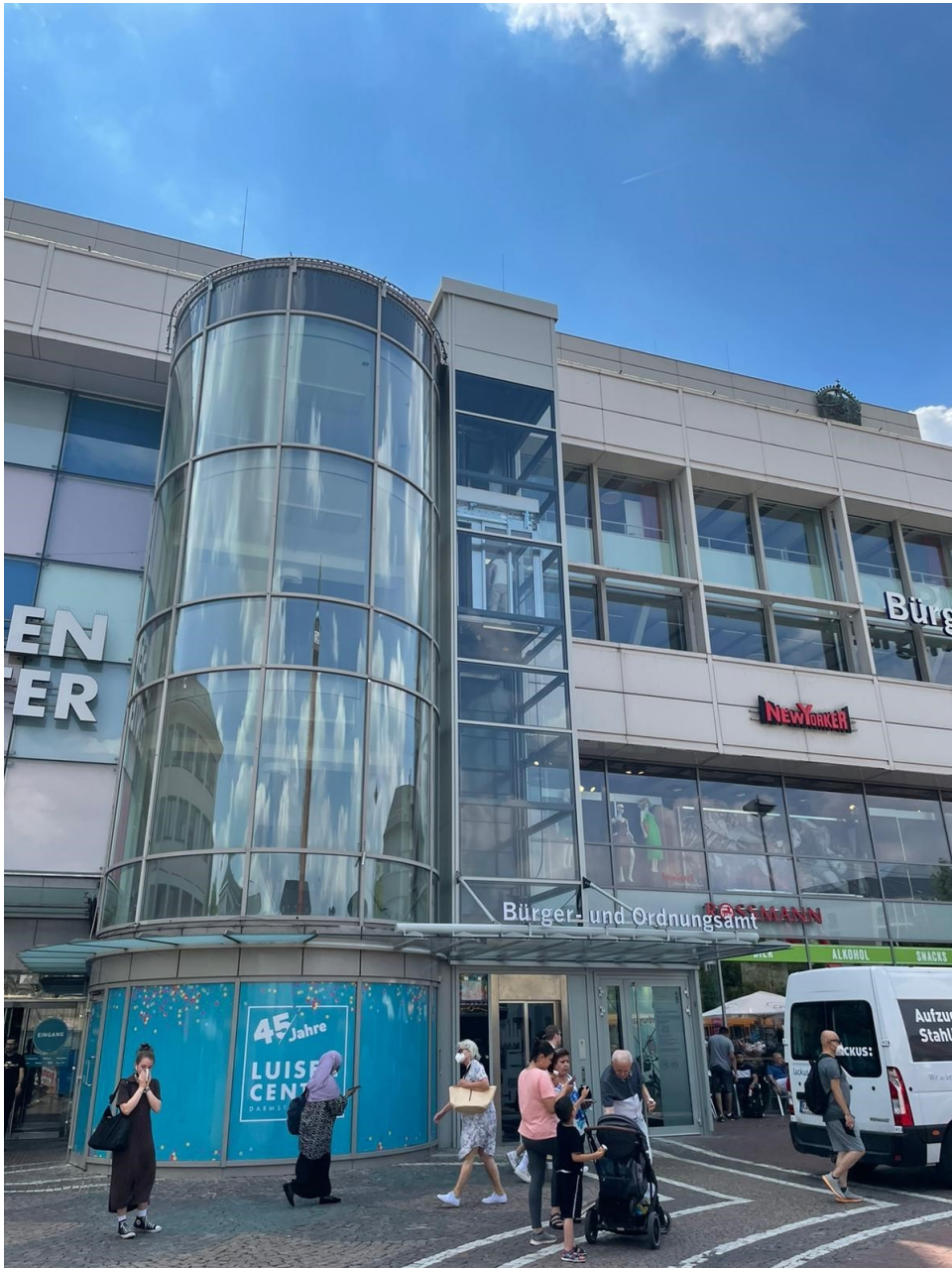
Per markantem Außenaufzug ist das Bürgeramt der Stadt Darmstadt im Luisencenter zu erreichen.